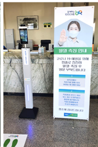
농협 NH BANK / 하나로마트