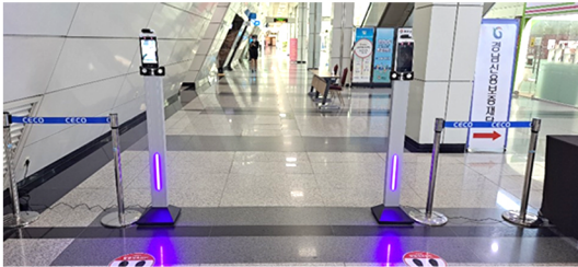
창원 전시장 CECO