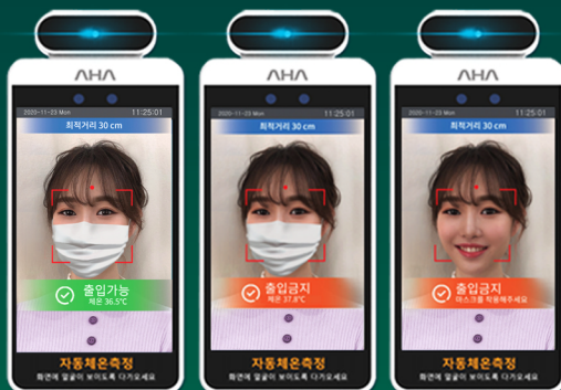
마스크 미착용 및 고체온은 출입 금지