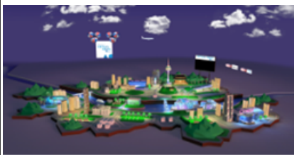
[버추얼 서울 2.0 메인 로비]