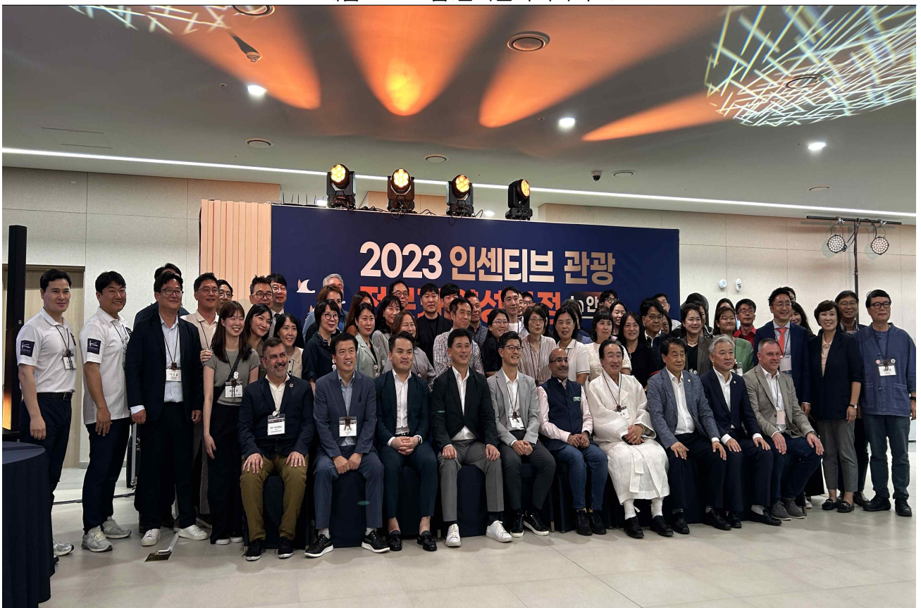
▲ 수료식 및 환영만찬_단체사진