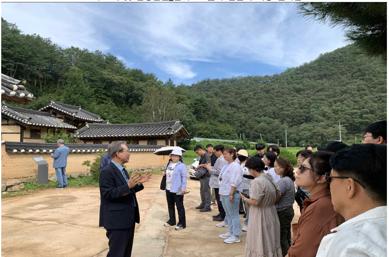
▲ 안동 유니크 투어