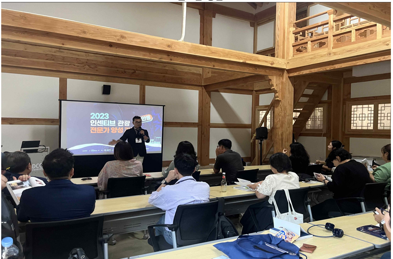
▲ 스페셜 강연