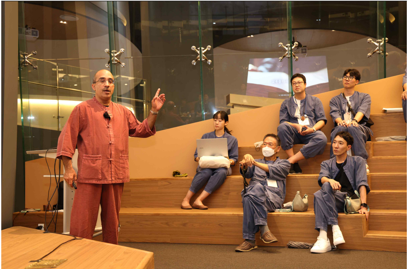
▲ 글로벌 강연