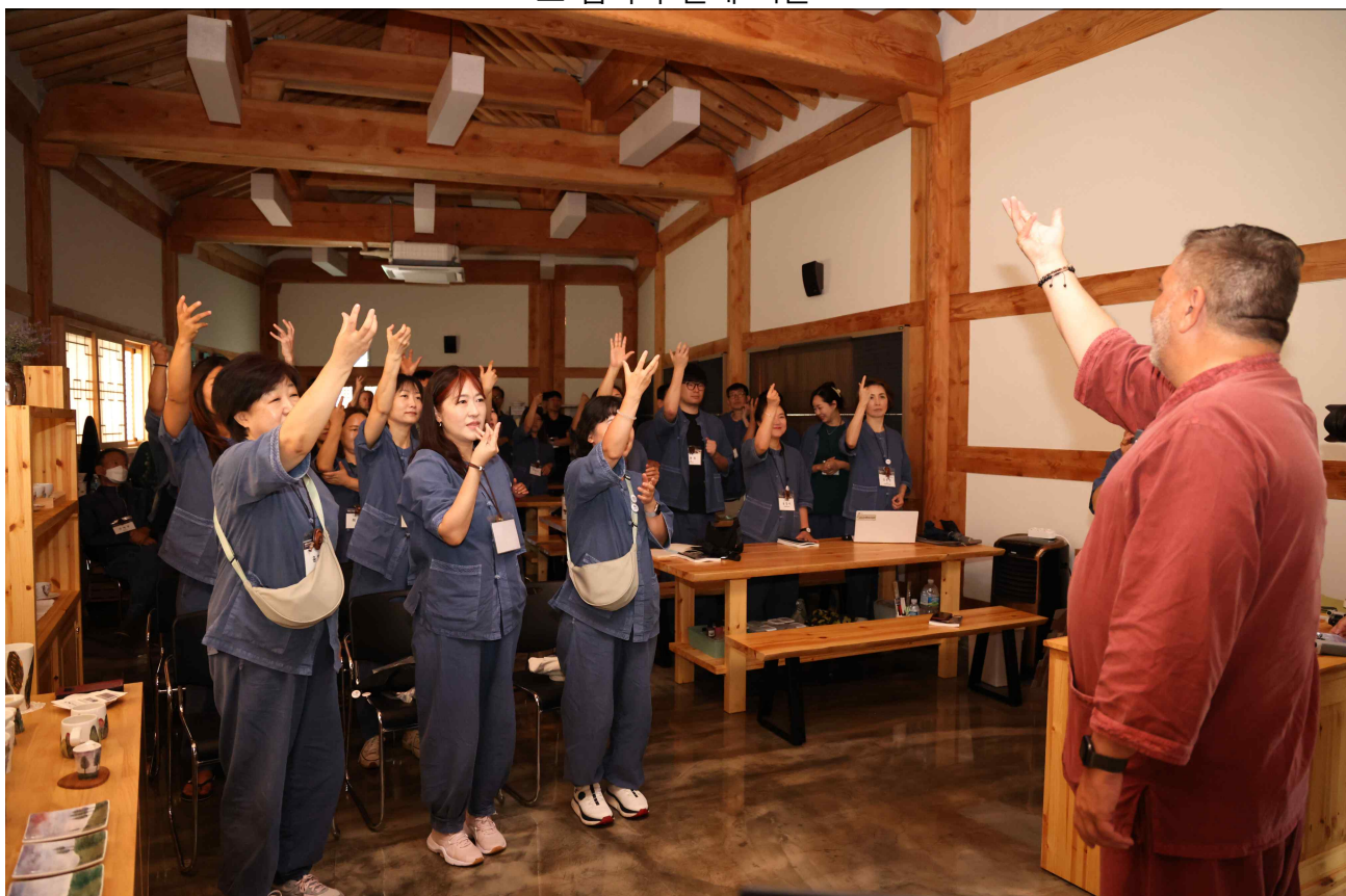
▲ 글로벌 강연