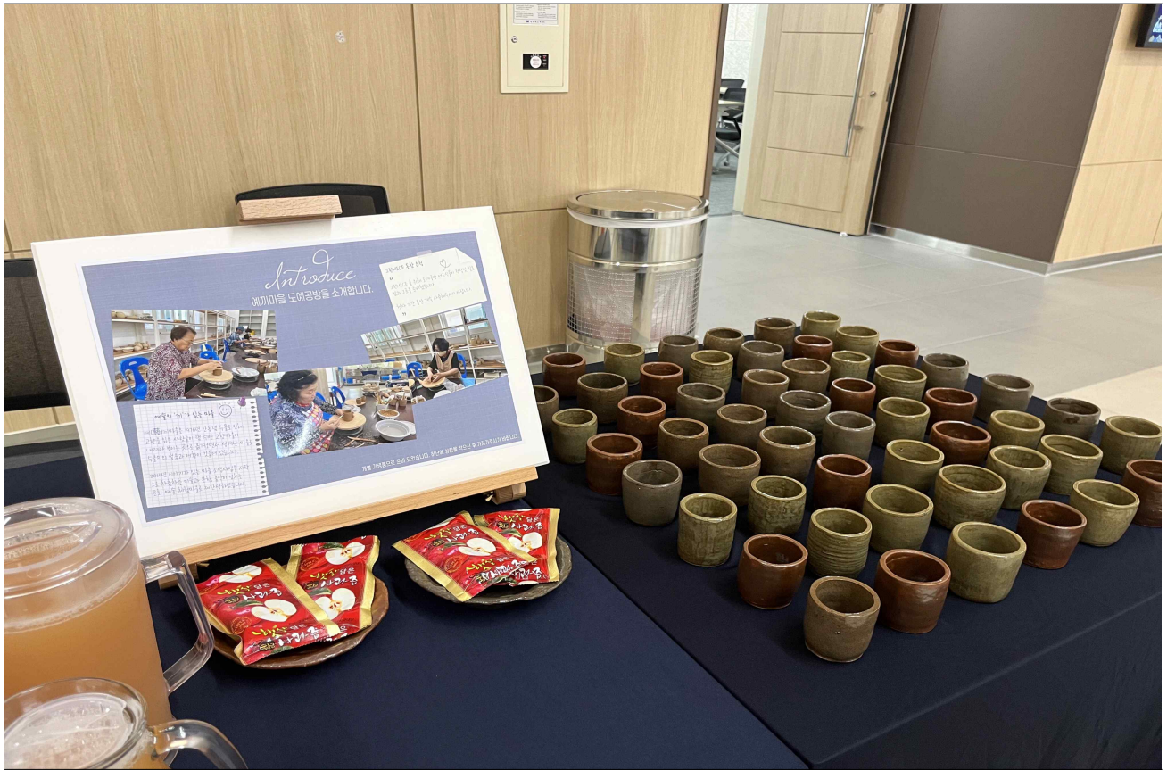
▲ 예기마을 컵 & 안동사과잼