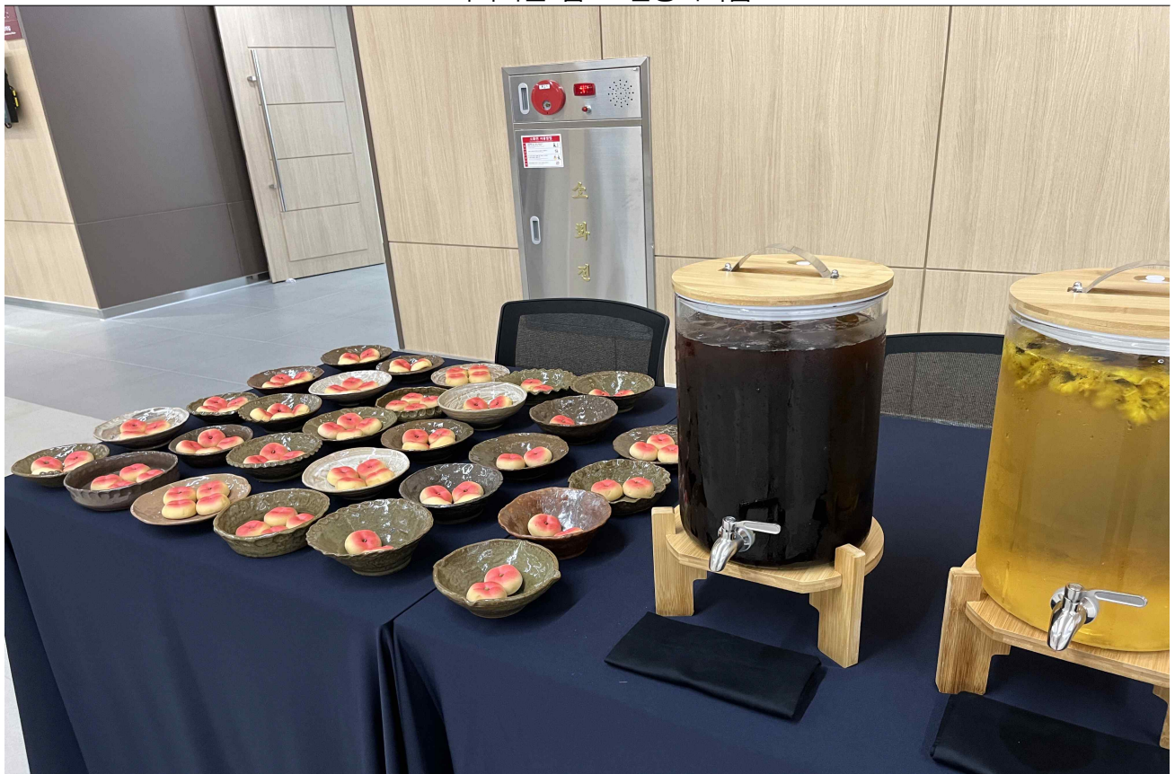
▲ 예기마을 그릇 & 안동사과빵