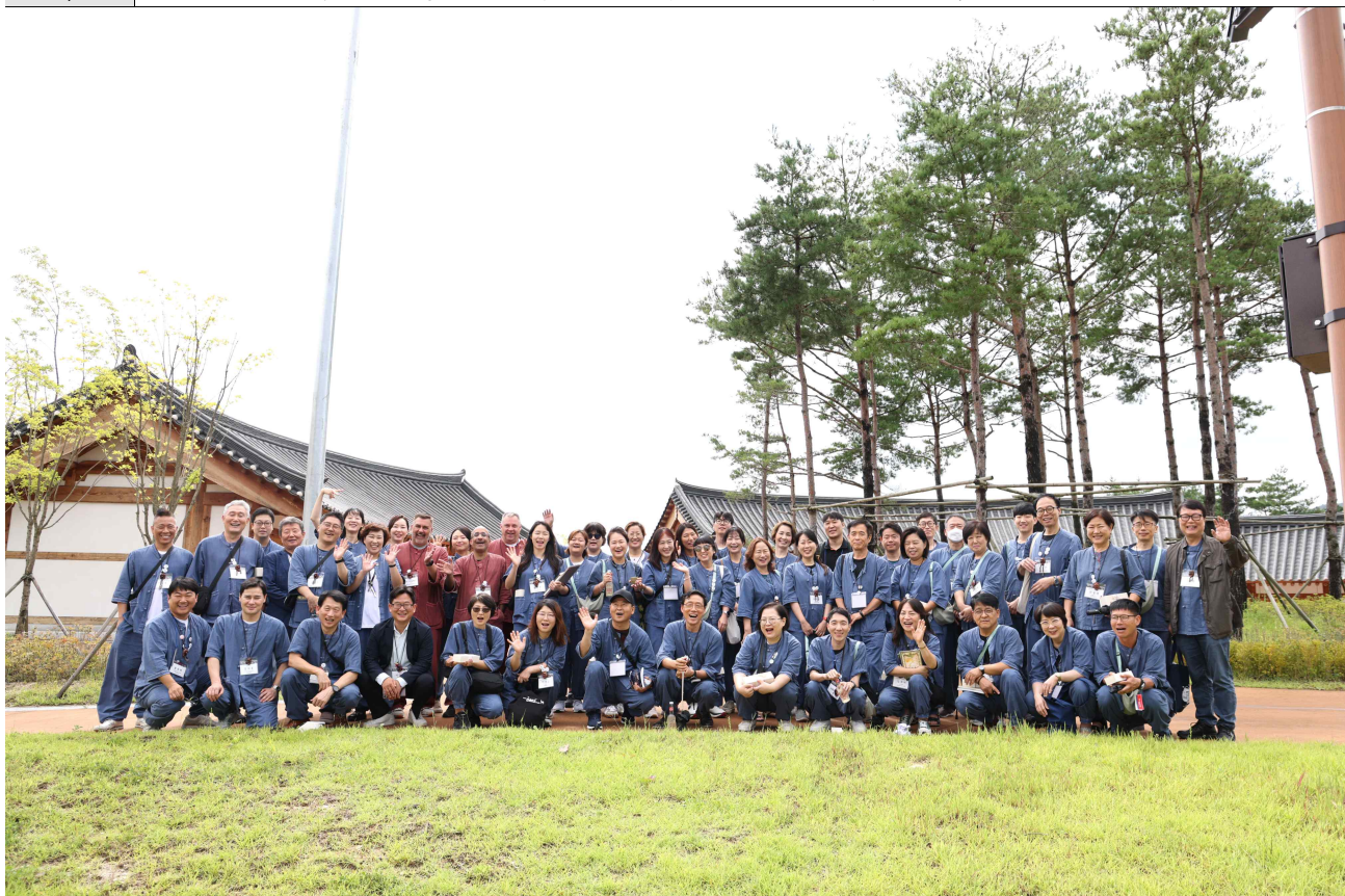
▲ 참가자 단체 사진