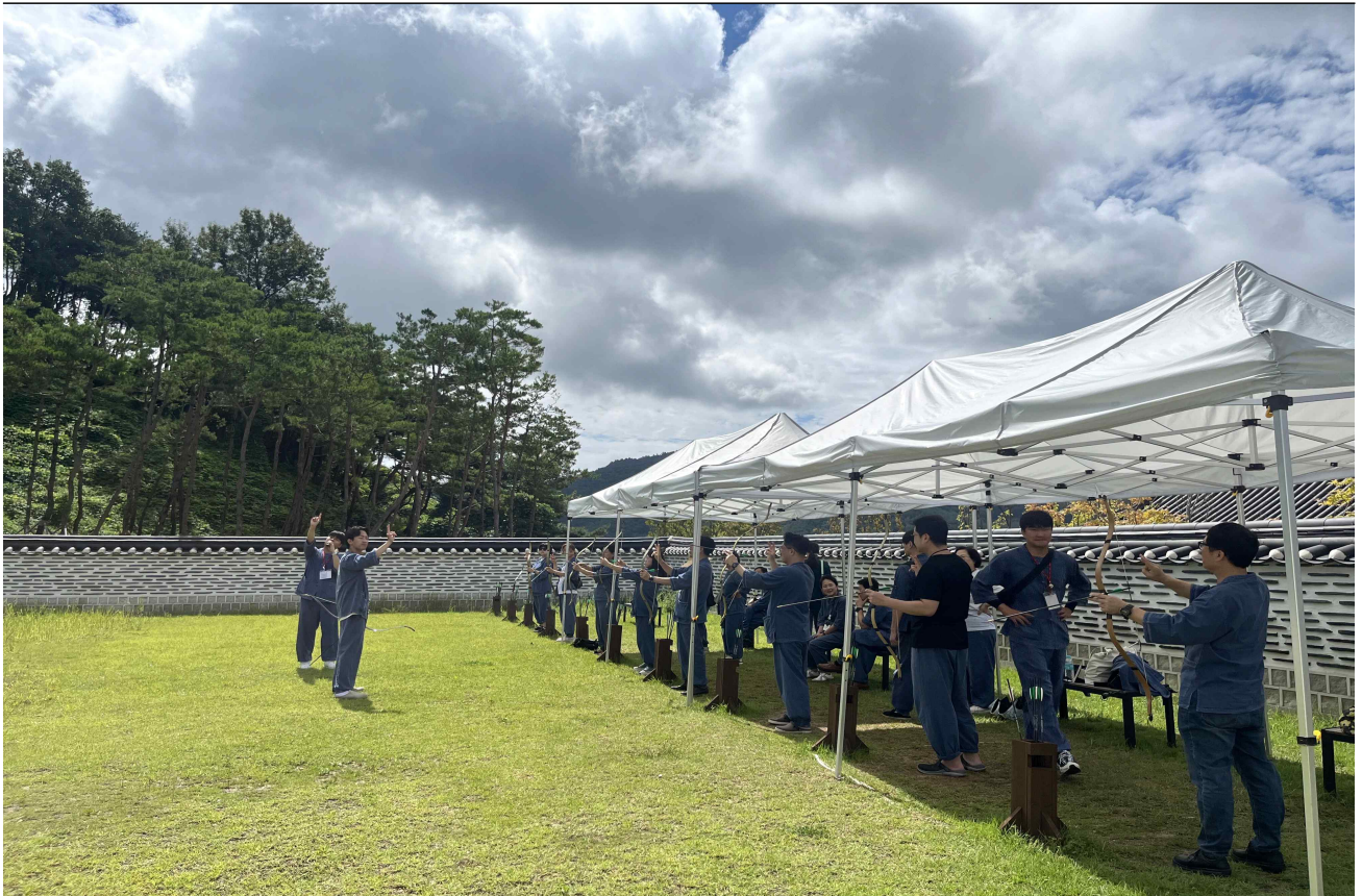
▲ 체험 프로그램(한국문화테마파크)