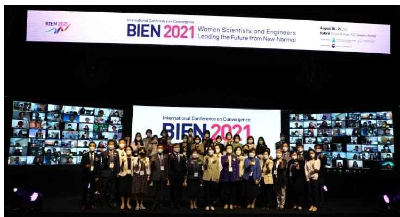
예시) KWSE 국제여성과학기술인대회 BIEN 2021

※ 2개 이상 회의장이 운영될 경우, 주 행사장 외 회의장에서도 시청 가능