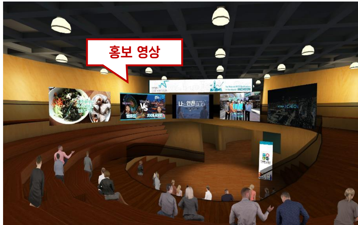
* 트라이볼 내부공간